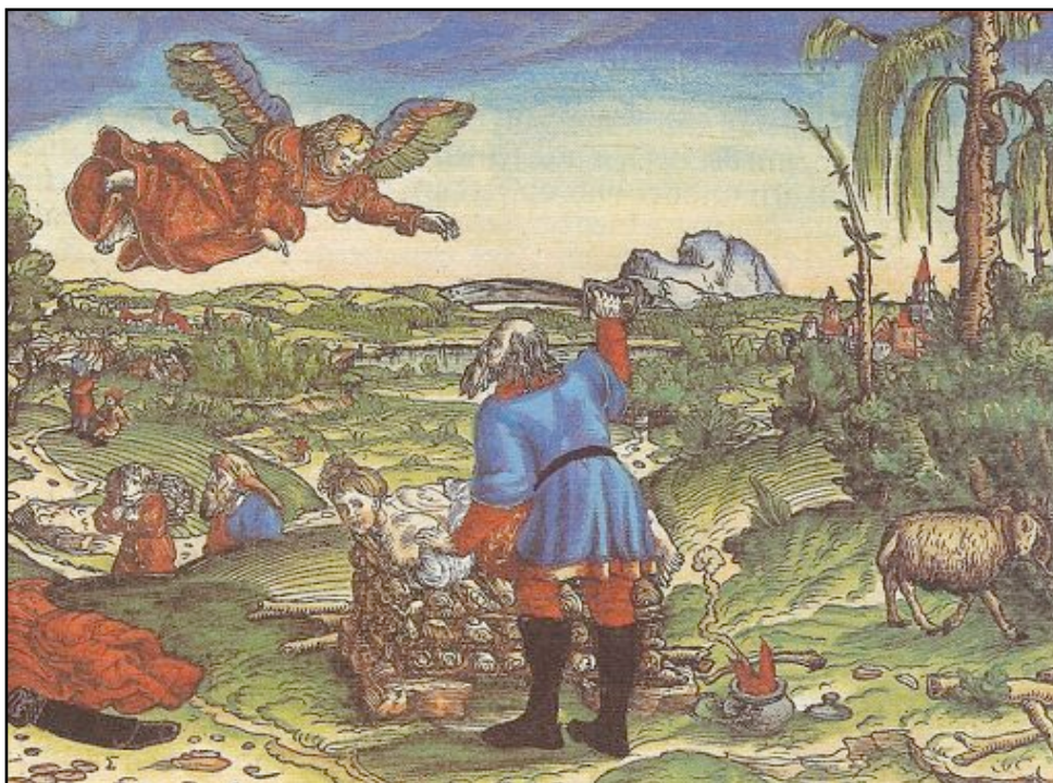
Abraham og Isak fra Luther Bibel av 1534

Isak fortsatte att bo i trakten i utkanten av löfteslandet. Han sådde säd och fick god skörd och blev till slut så mäktig att filistéerna inte ville veta av honom och därför tog sig för att fylla igen hans brunnar (1 Mos 26:12-23). Isak drog sig då undan till trakten av Beer Sheva och efter en tid återställdes friden mellan honom och filistéerna (1 Mos 26:26-31).