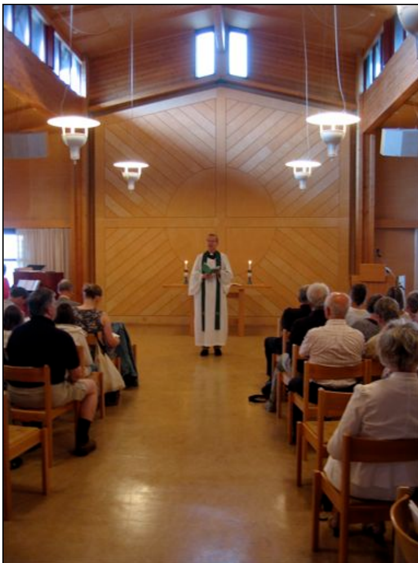
"Gudstjeneste på sommerleiren 2009"