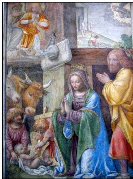
“Jesu födsel -Louvre Paris

ålder sina texter och sitt speciella tema, så att vi under årets lopp tar upp alla de olika sidorna av den kristna tron, så att vi efter apostelns föredöme får förkunna allt Guds rådslut. På så vis vet också både prästen och församlingen vad som gäller, vilka texter som ska läsas och vad det ska predikas över.