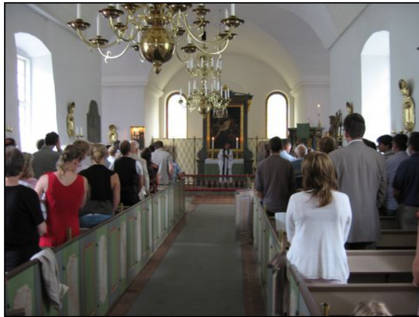
Fra årskonferansen 2007

Så tar han oss med som lärjungar till den heliga nattvarden. Låter oss instämma i änglarnas lovsång, Sanctus, Jes 6, och låter oss höra hans instiftelseord och bejaka dem med vårt Amen och vi får be den bön han själv gav oss.