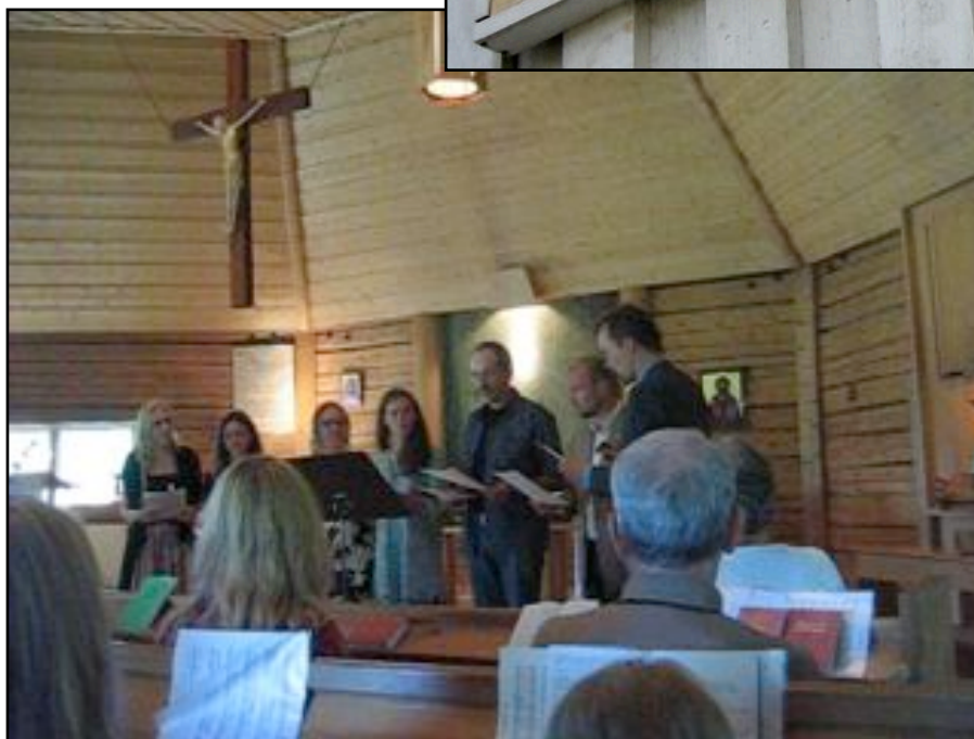
Menighetskor fra St. Andreas

Aftonsång avslutar vår kyrkodag, där vi sjunger ur Psaltaren samt antifoner med anknytning till aposteln Andreas (Matt.4:18-20, Joh.1:40). Vi läser Jer.31:31-34 som är GT text för 1 i Advent.