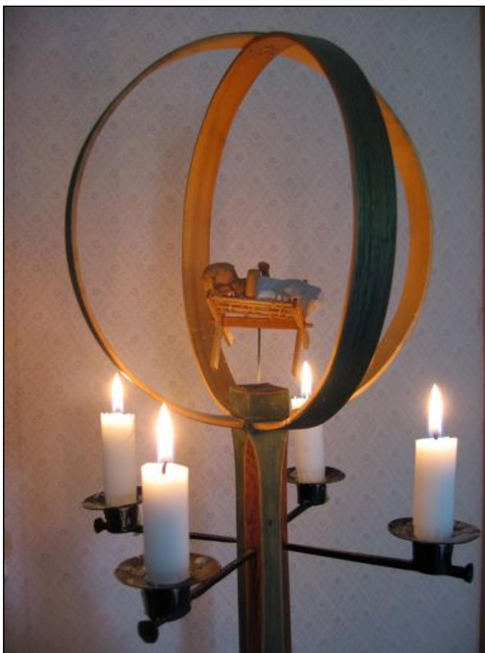
"Julekrybben- av Gunnar Åkerström, St. Andreas kapell.