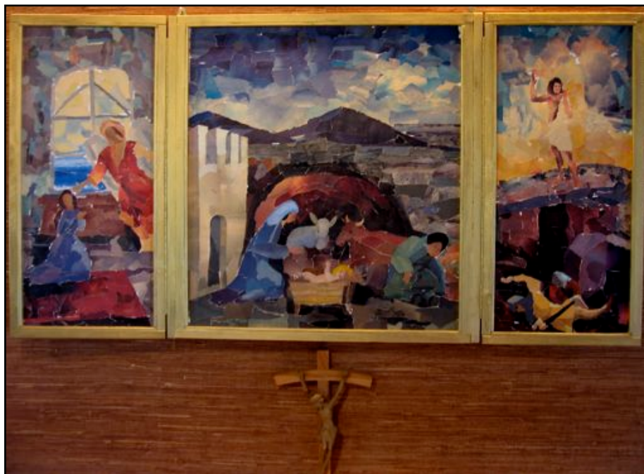
Altartavle i St. Andreas av Barbro Åkerström.