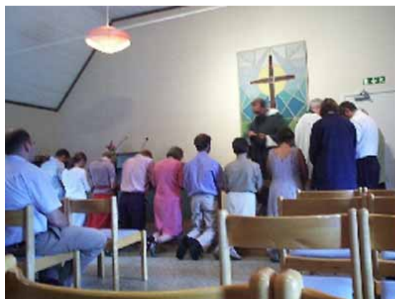
”Fra høymessen på årskonferansen 2000” ghj

Och låt oss därtill inte glömma att Herren Jesus sagt till sina lärjungar i alla tider: ”Jag är med er all dagar intill tidens ände.” Matt 28:20