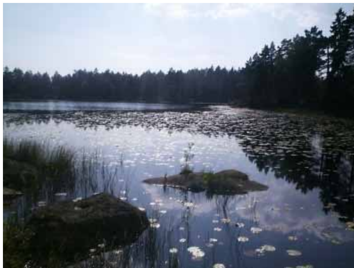
"Bergsjøtjern, et vakkert skaperverk"

Bibelen forteller at det også eksisterer onde og demoniske åndsvesner (3Mos.17:7, Ef.2:2) som er frafallne engler. Men de får ikke gjøre mere enn det som tillates dem, Se: Luk.13:10, Rom.16:20,