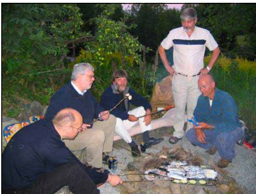
Nordisk uformell kirkeprat og et fiskemåltid på Knapstad aug.2004

felleskap der vi kan dele presteressursene mellom oss og ikke minst styrke hverandre i et fellesskap rundt samme nattverdsbord. Vi skal sammen forkynne Herrens død. Vi skal vise andre lutherske kristne i Norden som vandrer rundt som får uten hyrde og som ikke vet hvor de skal søke støtte og fellesskap at her er vi noen få i Danmark, Sverige, Finland og