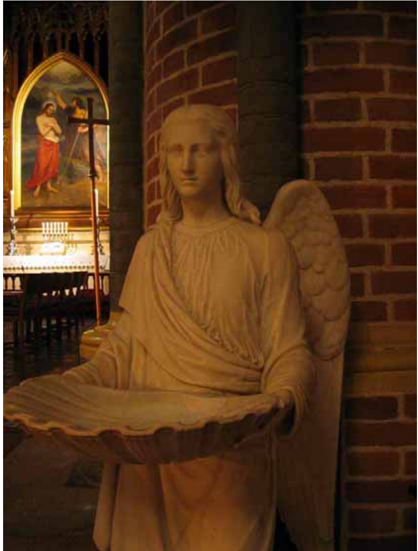
. Fra Trefoldighetskirken i Oslo.

oss. Och detta ängelns budskap gällde inte bara för de herdarna som såg och hörde ängeln då, han säger ju att det ”gäller hela folket”. Ja, detta saliga julens budskap får vi alla ta till oss, även vi som lever i denna den sista den vi kan tycka allra mörkaste tid. Var alltså inte förskräckt även om synd, värld eller djävul anklagar, Gud är med oss, för oss, hos oss, ja en av oss.