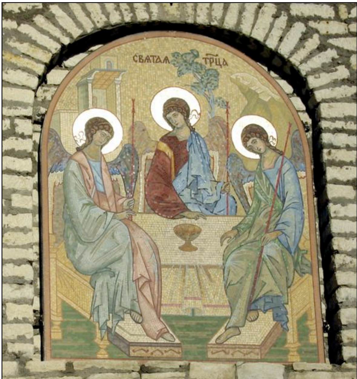
Den Hellige Treenighetskatedral, Pskov i Russland, utvendig veggmaleri.