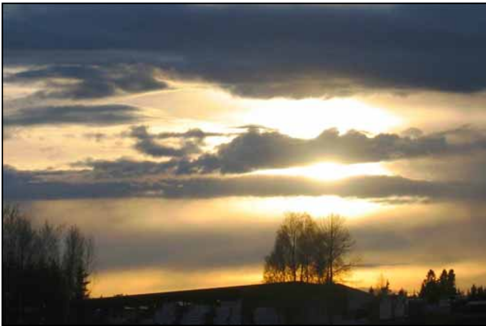
Luk 21:25 Og det skal vise seg tegn i sol og måne og stjerner. .Foto: Gunnar A Hjorthaug

Apgj.14:22: "Vi må inn i Guds rike gjennom mange trengsler. "Kristi rike på jorden kommer til å forbli et rike under korset inntil verdens ende.